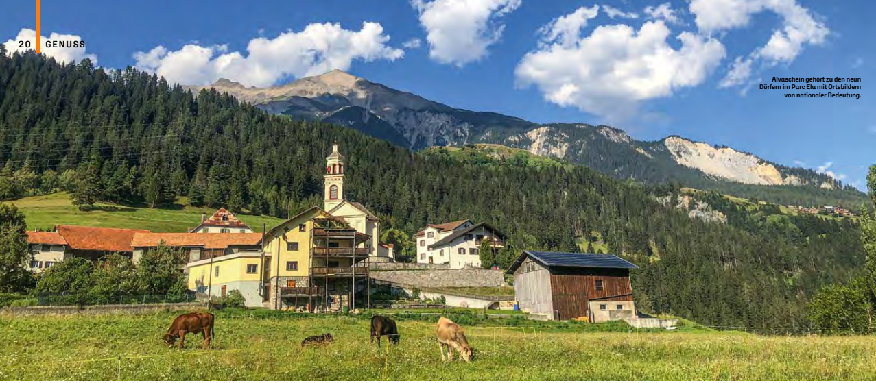
Alvasein gehört zu den neun Dörfern im Parc Ela mit Ortsblättern von nationaler Bedeutung.