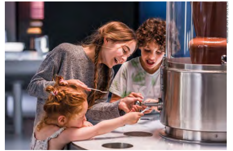
Eine eigene Schokowerkstatt, Degustationen und der Riesenschokoladenbrunnen begeistern die Besucher.

E in über neun Meter hoher Schokoladenbrunnen, Geschichte(n) um Kakaobau, Schokoladegeschichte, die Schokoladepioniere in der Schweiz und die Produktion der süssen Versuchungen, ein Degustationsraum und die Chocolateria, wo man eigene Schoko-Kunstwerke kreieren kann – wie im Schokoladenhimmel fühlen sich die Besucher seit 13. September in Kilchberg, dem Zuhause der berühmten Maitres Chocolatiers von Lindt. Die neue Schokoladenwelt beim Stammhaus des renommierten Herstellers zieht als einzigartiges Schokoladenkompetenzzentrum Familien, internationale Gäste, Fachkräfte und Wissenschaftler gleichermaßen an, zeigt sie doch auf 1500 Quadratmetern neben der multimedialen, interaktiven Ausstellung auch eine For-