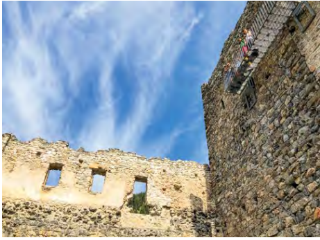
Belfort ist eine der historisch wichtigsten Burgruinen Graubündens bei Brienz. Ein Erlebnis mit Feuerstelle für die ganze Familie.

Zurück zum Bahnhofplatz Tiefencastel. Vielleicht steigen wir doch in den Bus nach Bivio, dem letzten Dorf vor dem Pass nach Julier, der ins Oberengadin lockt. Trotz