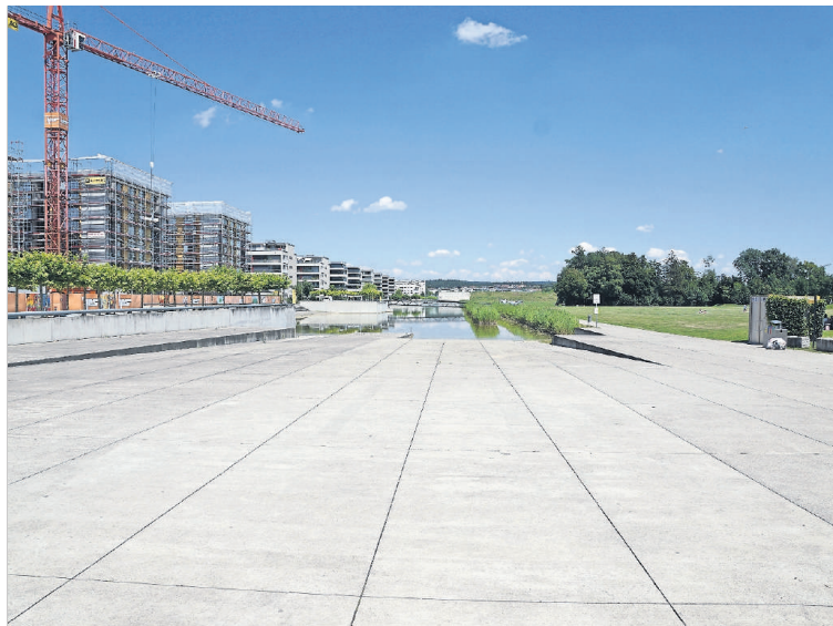
Immer mehr geschlossene Flächen beschwören vielerlei Probleme herauf: Das Südende des Opfikersees.

Warum wurden und werden nach wie vor riesige Flächen geteert oder betonierte wie beispielsweise die Europa-Allee oder der neue Tramhalteplatz in Schlieren? Die Böden werden versiegelt, Regenwasser versickert nicht